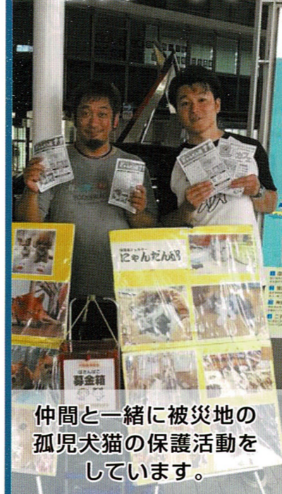
仲間と一緒に被災地の孤児犬猫の保護活動をしています。