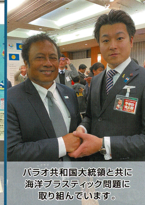
パラオ共和国大統領と共に海洋プラスチック問題に取り組んでいます。