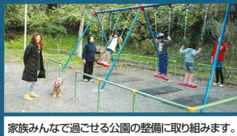
家族みんなで過ごせる公園の整備に取り組みます。