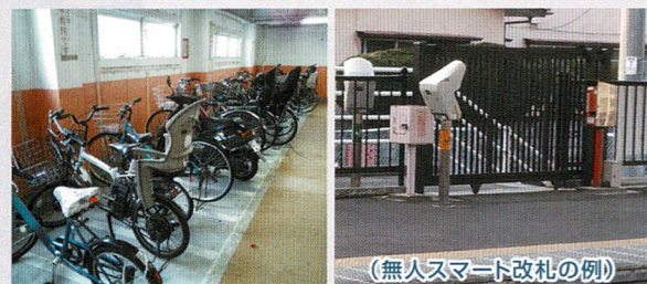
駐輪場整備で気軽にお買い物