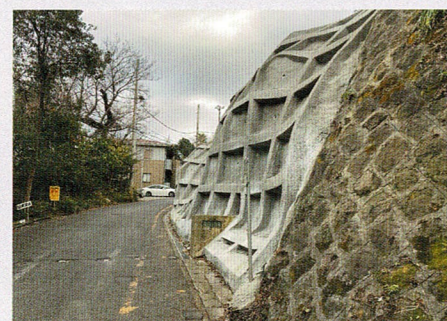
谷戸の多い逗子市には重要なかけ地対策