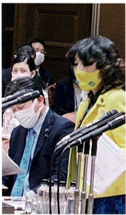
▲令和4年6月参議院予算委員会にて

党新型コロナウイルス等感染症対策本部副本部長として、ワクチン接種の円滑で安全な実施、特に介護関係者・保育・鍼灸師・柔道整復師・旅客・運送等、エッセンシャルワーカーへの優先接種。