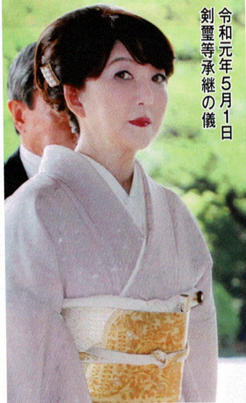
令和元年5月1日 剣聖等承継の儀