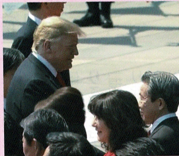
トランプ大統領(当時)歓迎行事(皇居)