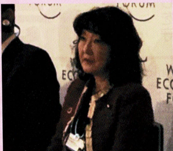
2019年ダボス会議(世界経済フォーラム)で規制改革大臣として講演