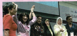
WPL(女性政治指導者サミット)(東京)