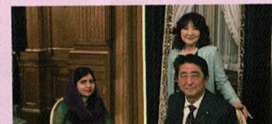
ノーベル平和賞のマララ・ユスフザイさんと歓迎会にて