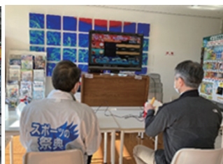
自ら体験「太鼓の達人ゲーム」