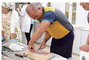
魚のさばき方教室