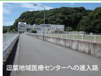
返葉地域医療センターへの進入路

まずは、「 返葉地域医療センター 」 進入路の返還 から。生態系を守りながら、返子市民の憩いの場となるよう更なる活用を進めます。