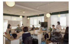
ワーケーションスペース