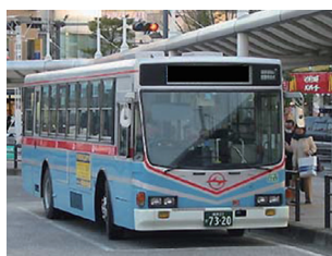
ふれあいパスで外出促進