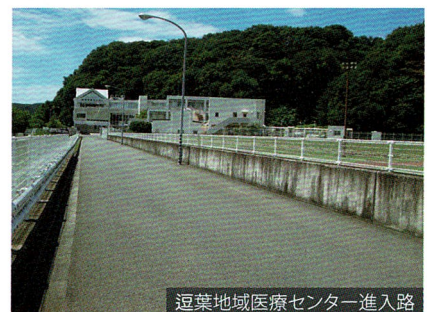
逗葉地域医療センター進入路