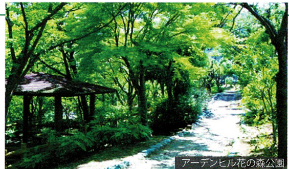
アーデンヒル花の森公園