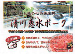
柔らかくてほんのり甘い恵水ポーク