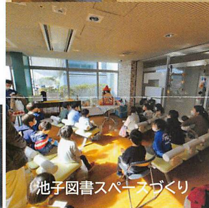
池子図書スペースづくり