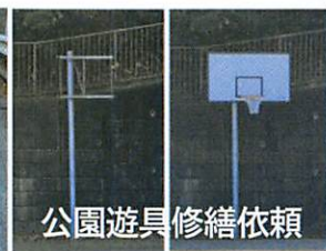
公園遊具修繕依頼