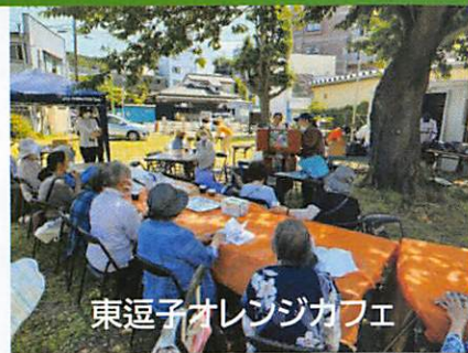
東逗子オレンジカフェ