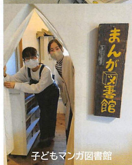
子どもマンガ図書館